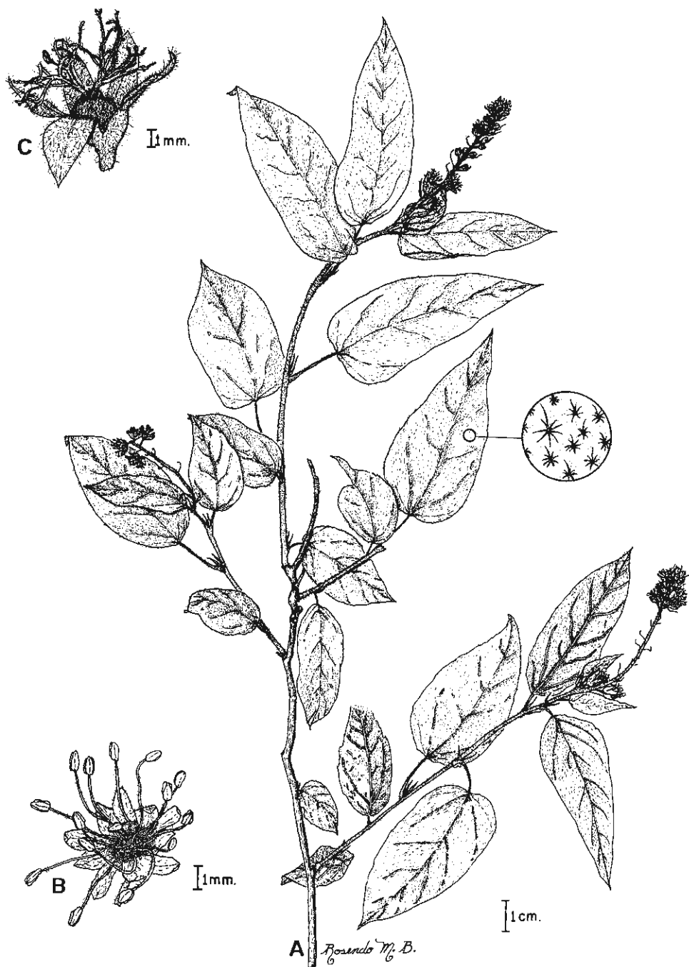
Fig. 2. Croton acapulcensis (Basado en N. Noriega Acosta 599). A. Aspecto general de una rama, B. Flor estaminada, C. Flor pistilada.